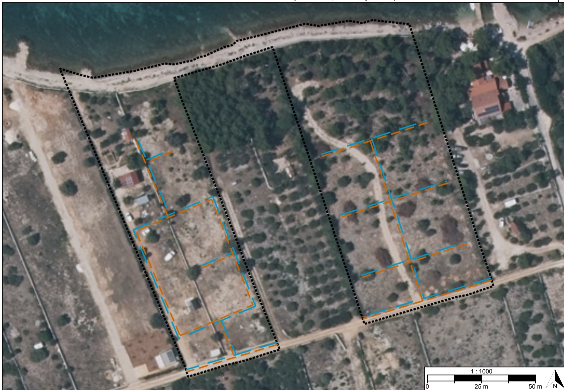
Postupak izrade i donošenja prostornog plana Urbanistički plan uređenja ugostiteljsko-turističke zone "Girenica" (UPU 19)